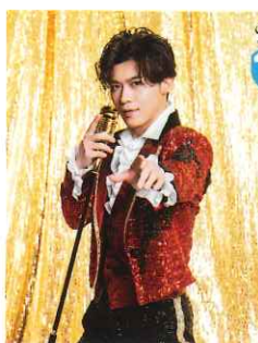
Singer 新浜レオン - 演歌歌手