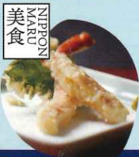
美食 NIPPON MARU