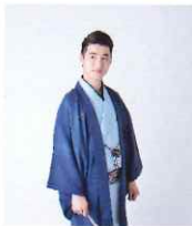
Rakugo 林家木久彦 - 落語家

令和元年にデビュー。デビュー曲「離さない 離さない」で「第 61 回日本レコード大賞」新人賞を受賞。23 年にリリースした「捕まえて、今夜。」は名探偵コナンのオープニング主題歌に抜擢。SNS でも総再生回数は 1 億回を超えた。24 年「第 75 回 NHK 紅白歌合戦」初出場。