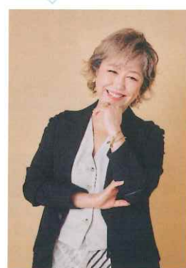
澤田知可子 歌手 CHIKACO SAWADA

1987年に『恋人と呼ばせて』でデビュー。1991年に『会いたい』で日本有線放送大賞受賞、NHK紅白歌合戦出場。2000年に『21世紀に残す涙の名曲ベスト100』第1位を獲得。2003年に『生きる力』をテーマにした『GIFT』が人間力大賞の厚生労働大臣奨励賞を受賞。2024年に『会いたい』が日本作曲家協会音楽祭にてロングヒット賞受賞。現在は『元祖・泣き歌の女王』として愛ある歌を全国コンサートで届けている。