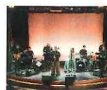
APP 歌手 ASUL PULA PUTI

海を撮影する写真家として国内外の客船に乗船を続けている。これまで寄港した国は80ヶ国、日本の津々浦々の港も訪ねる。船でしか行けない『小笠原のすべて』や世界の海の奇跡を納めた『ONE OCEAN』等、多くの著書を出版。