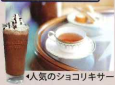
人気のショコリキサー

一日三食の船内の食事は全て旅行代金に含まれています。そしてグリルバーやアフタヌーンティー、夜食も無料です。創意工夫溢れる一皿を。