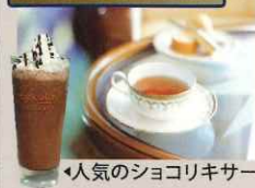
人気のショコリキサー

一日三食の船内の食事は全て旅行代金に含まれています。そして Grill Bar やアフタヌーンティー、夜食も無料です。創意工夫溢れる一皿を。