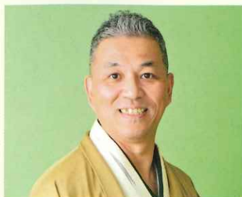
三遊亭金八 (落語家)

2019年デビュー。テレビ「徳光和夫の名曲にっぽん」でアシスタントMC出演中。昭和歌謡をリスペクトし、ライブやSNS配信で活躍中。オリジナル曲がオリコン演歌・歌謡曲ランキングで1位を獲得。