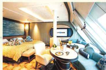
オーシャンビュースイート (一例)