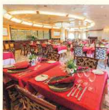
オーシャンダイニング春日 (スイート・デラックスルームの方)