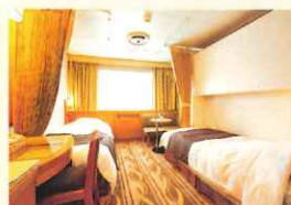
コンフォートステート (一例)