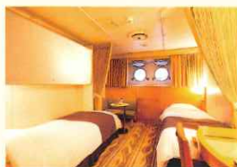
スタンダードステート (一例)

2・3・4階 シャワー・トイレ付/14㎡~18㎡/2名1室利用・3名1室利用(2階に6部屋) 4階 バス・トイレ付/27㎡/バリアフリー(車椅子対応) 2名~3名1室利用