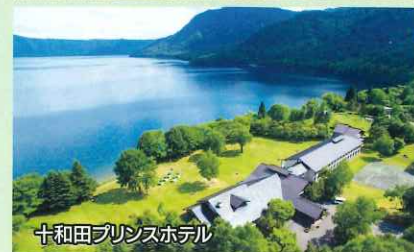
十和田プリンスホテル