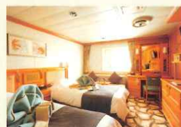
デラックスツイン (一例)