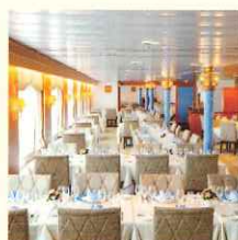
メインダイニング瑞穂 (ステートルームの方)