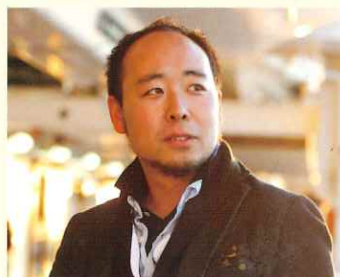
中村風詩人 (写真家)

北海道根室市出身。1990年、三遊亭金馬に入門。住み込み弟子として修行。前座となり楽屋入り。上野鈴本演芸場で初高座。1993年、二つ目昇進。2002年、真打ち昇進。