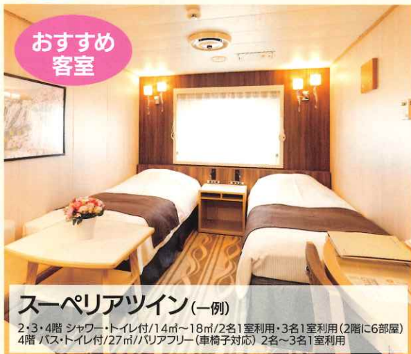
スーペリアツイン (一例)

2・3・4階 シャワー・トイレ付/14㎡~18㎡/2名1室利用・3名1室利用(2階に6部屋) 4階 バス・トイレ付/27㎡/バリアフリー(車椅子対応) 2名~3名1室利用