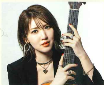
おかゆ (シンガーソングライター)

2019年デビュー。テレビ「徳光和夫の名曲にっぽん」でアシスタントMC出演中。昭和歌謡をリスペクトし、ライブやSNS配信で活躍中。オリジナル曲がオリコン演歌・歌謡曲ランキングで1位を獲得。