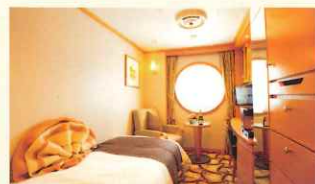
デラックスシングル (一例)