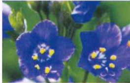
レブンハナシロ [6月~7月]

展望が開けるまでのトレッキングでは数々の植物が見られる。 開放感と好奇心を満たすルート。