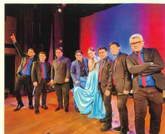
アスール★プラ★プティ★

海を撮影する写真家として国内外の客船に乗船を続けている。写真講座や海のお話などソフトなトークでの講演が大人気。