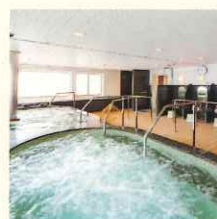
大浴場 (グランパス)