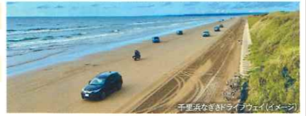
【氷見温泉郷 魚巡りの宿 永芳閣 泊】

1 昼 仙台空港発(12:15予定) → FDAチャーター便にて石川県小松へ直行!! 午後 小松空港着(13:30予定) ※チャーター便のためフライトスケジュールが変更になる場合がございます 波打ち際を走る △千里浜なぎさドライブウェイ ○「能登千里浜レストハウス」にてショッピング 能登金剛を代表する、日本海の荒波が生んだ景観 ○巖門 その後、富山県氷見温泉郷へ ホテル着(17:50頃) 夕食 ホテルにて「お魚を中心としたお料理コース」をお召し上がりください