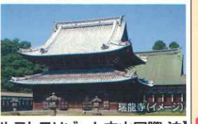
【ホテルテトラリゾート立山国際 泊】

1 昼 仙台空港発(12:15予定) → FDAチャーター便にて石川県小松へ直行!! 午後 小松空港着(13:30予定) ※チャーター便のためフライトスケジュールが変更になる場合がございます 壮大で美しい ○国宝・瑞龍寺 加賀2代藩主前田利長の菩提寺。中国渡来の禅宗の様式を如実に伝える江戸時代初期の建築物です。 その後、ホテルへご案内(17:25頃) 夕食 ホテルにて「会席料理」をお召し上がりください